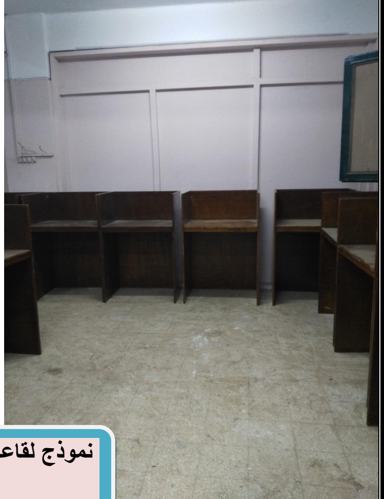
نموذج لقاعات الاستذكار بالمدن الجامعية