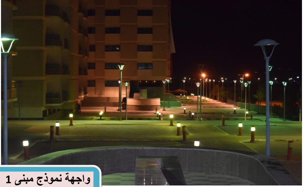
واجهة نموذج مبنى 1 للطالبات بمدينة سوهاج الجديدة