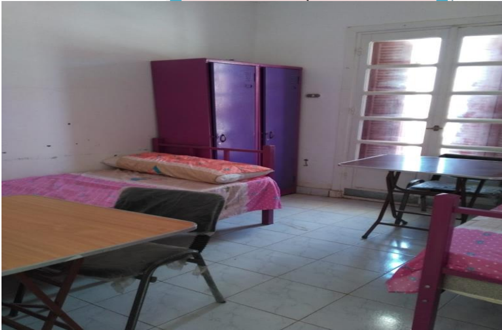
نموذج إحدى الغرف بالمدينة طلبة بسوهاج الجديدة