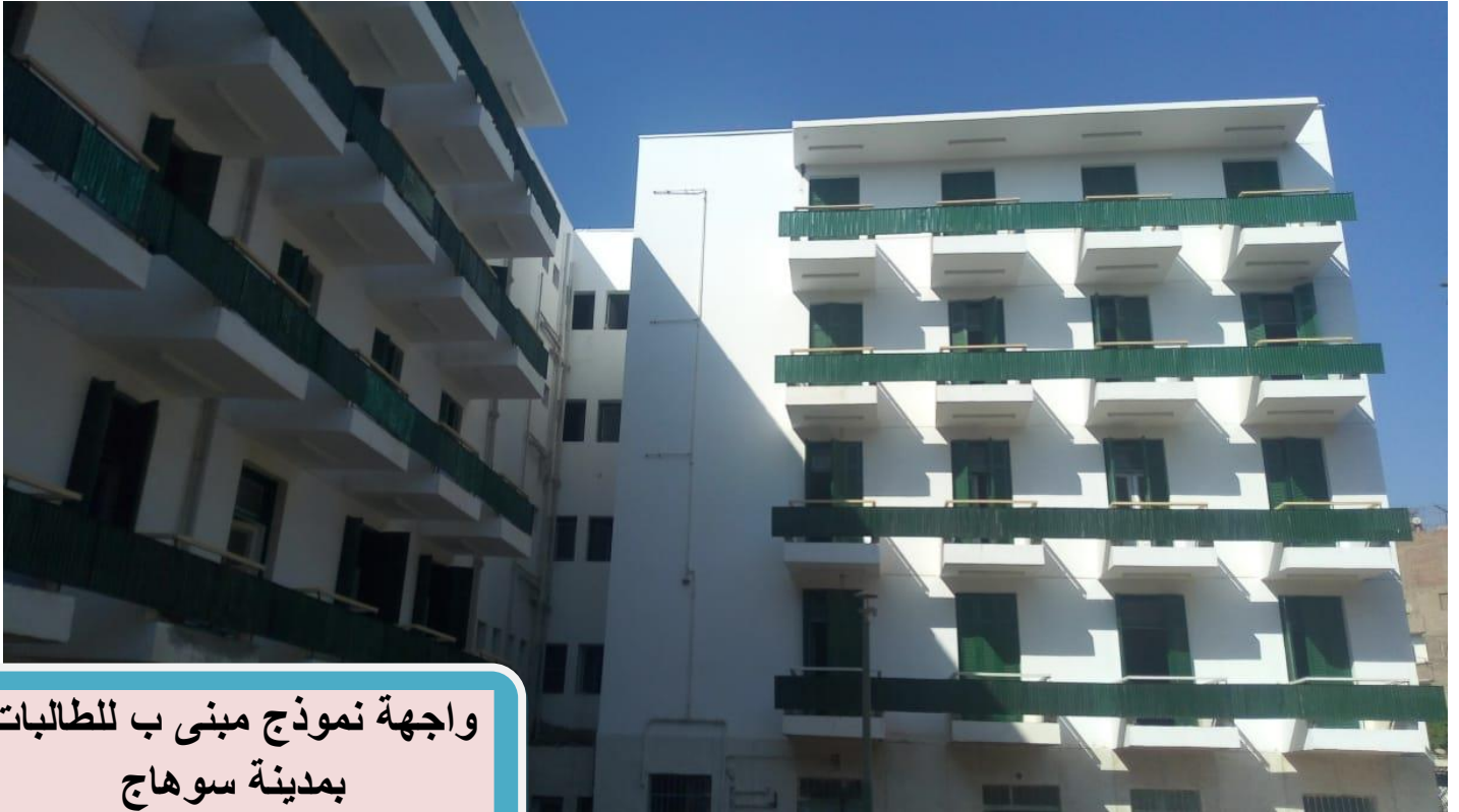
واجهه نموذج مبنى ب للطالبات بمدينة سوهاج