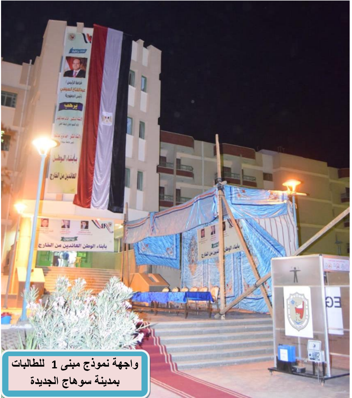
واجهه نموذج مبنى 1 للطالبات بمدينة سوهاج الجديدة