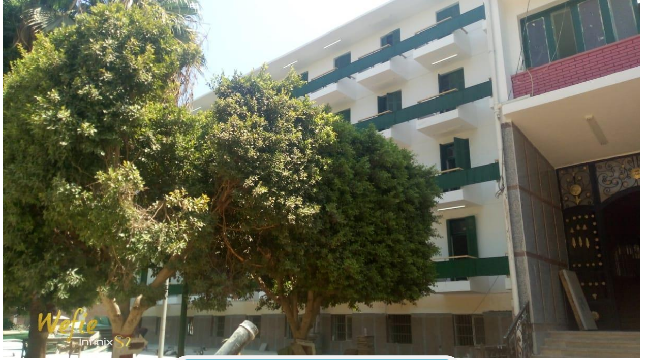
واجهة نموذج مبنى ب للطالبات بمدينة سوهاج