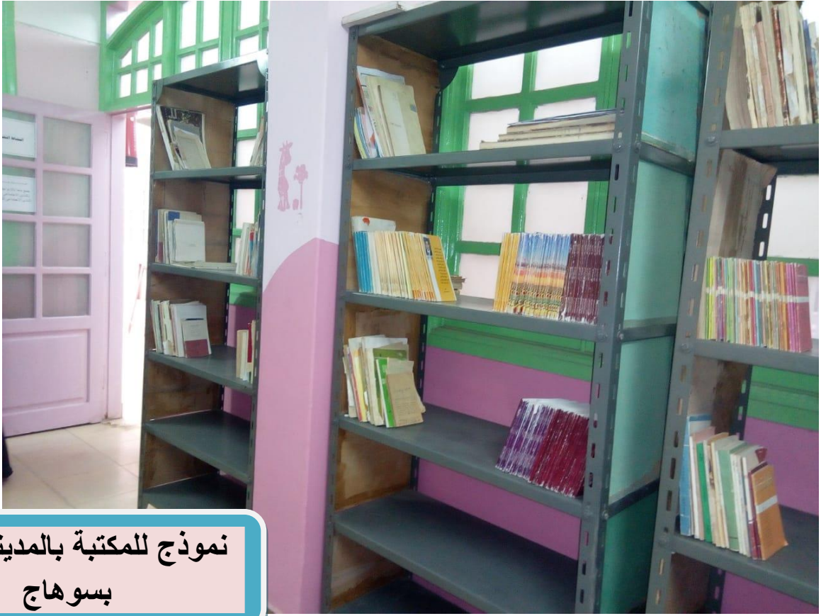
نموذج للمكتبة بالمدينة طالبات بسوهاج