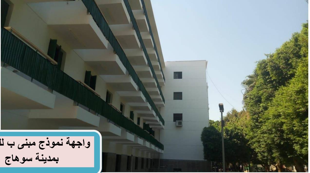
واجهه نموذج مبنى ب للطالبات بمدينة سوهاج