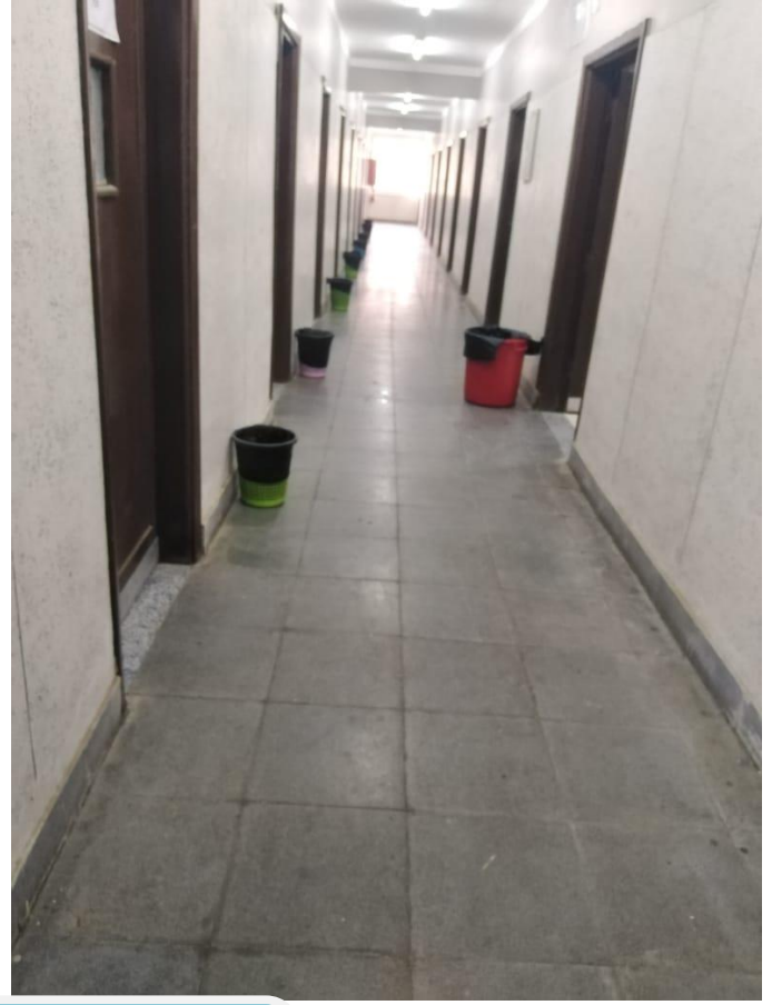
إحدى الطرقات بمبنى ب المدينة طالبات