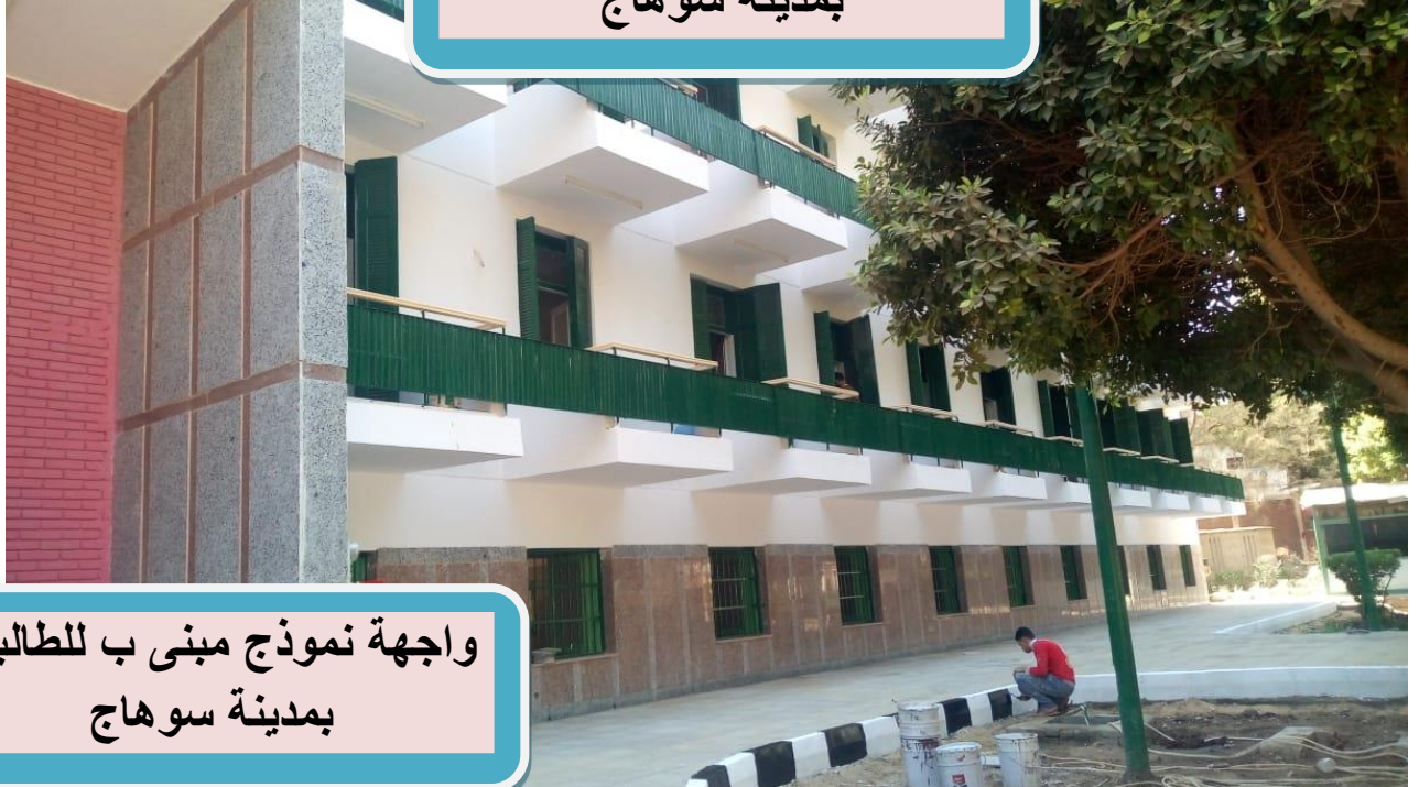
واجهة نموذج مبنى ب للطالبات بمدينة سوهاج