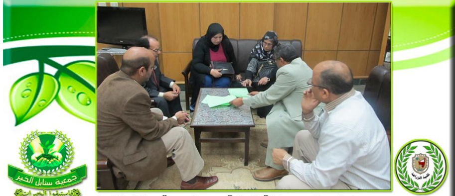
بروتوكول تعاون بين كلية الزراعة وبين (جمعية سنابل الخير)